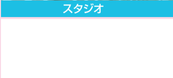
スイミングプール