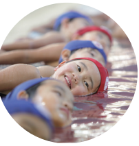
挨拶ができるようになった