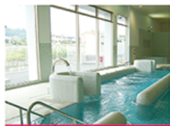
ウォーキングプール