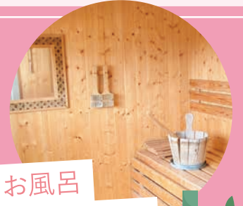
パーソナルサポート