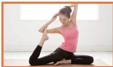
ヨガ・ピラティス