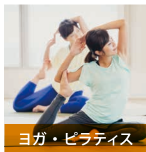
ヨガ・ピラティス