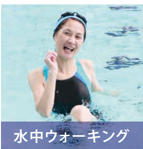
水中ウォーキング