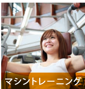
マシントレーニング