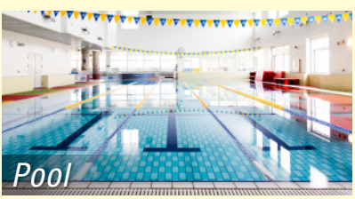
Pool 水の浮力で膝・腰に負担をかけずに全身運動!