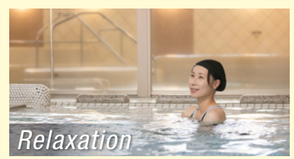
Relaxation 運動後もリラックスお風呂だけのご利用も可能です!